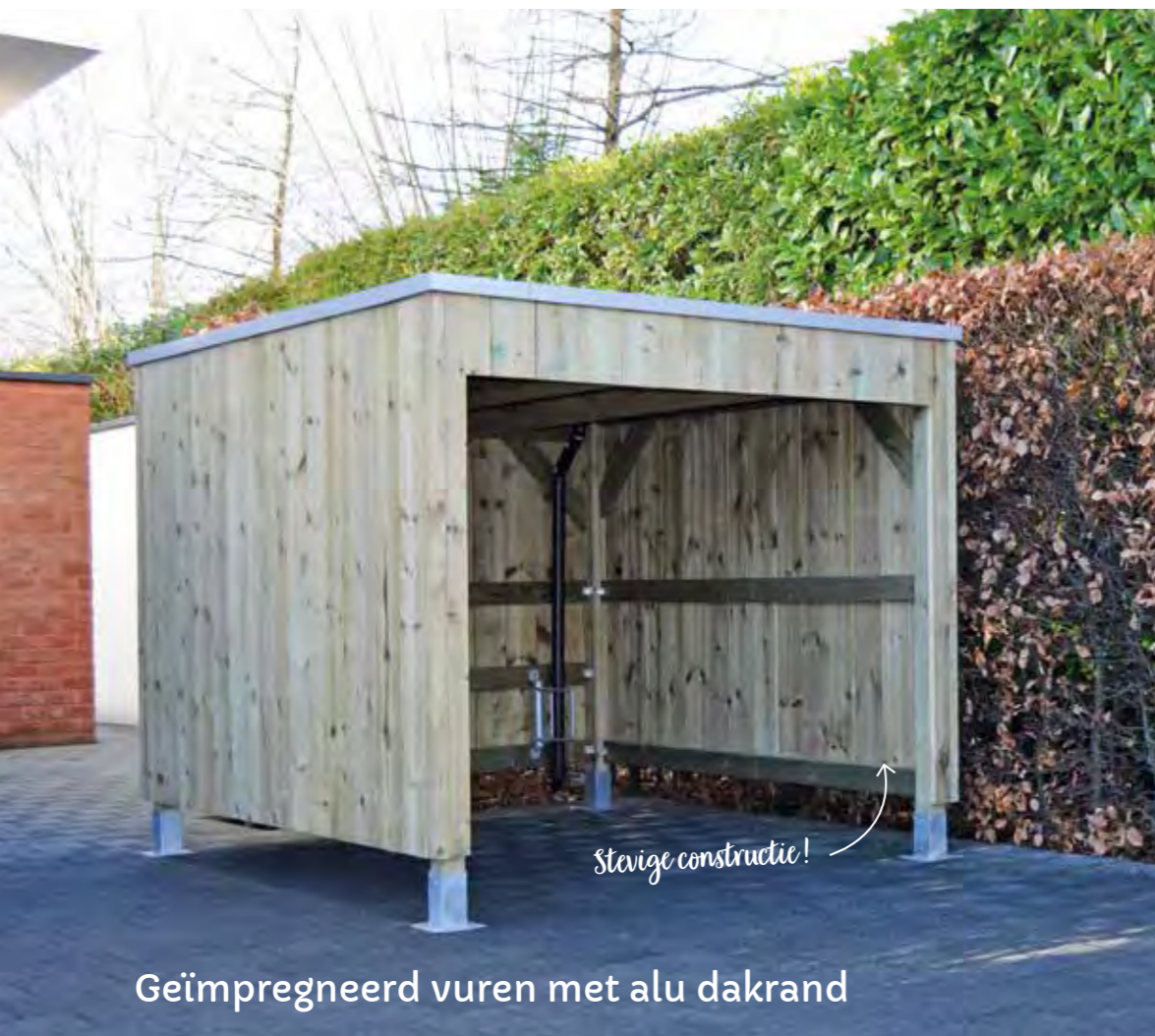
Geïmpregneerd vuren met alu dakrand