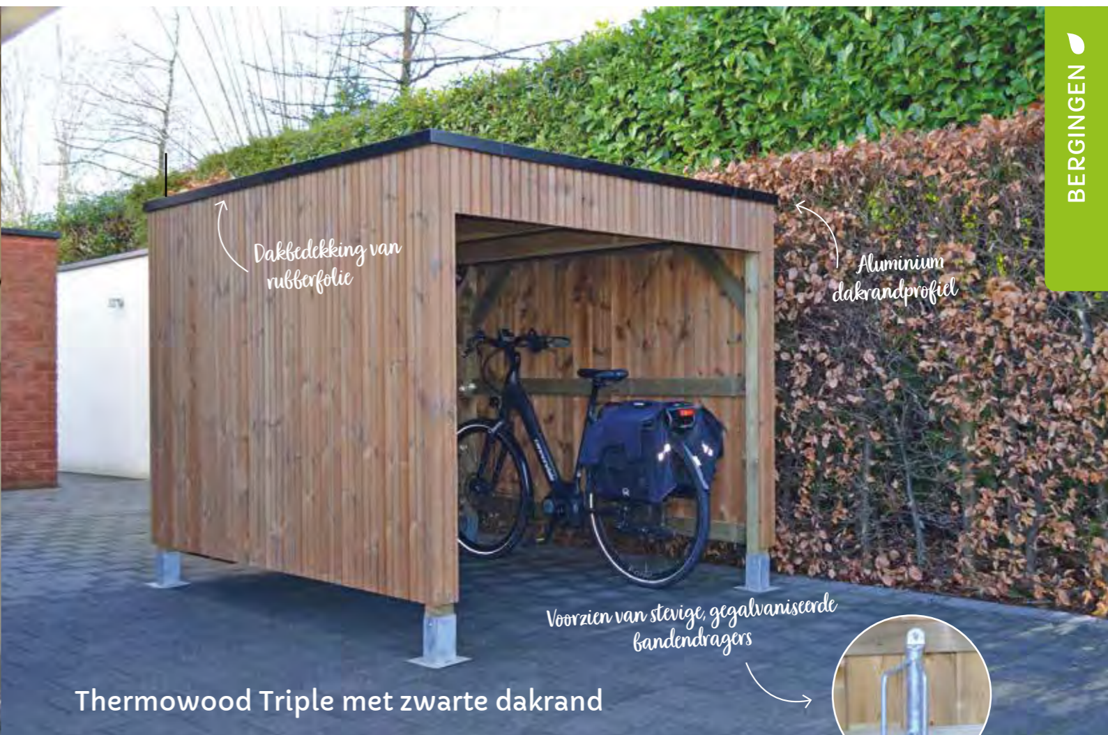
Thermowood Triple met zwarte dakrand